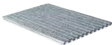
MEAGARD rošt s šedými hrubosrstými lamelami