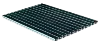
MEAGARD rošt s černými gumovými lamelami