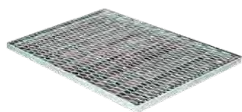
MEAGARD rošt tahokov