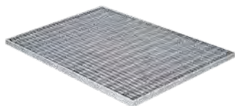
MEAGARD rošt tahokov